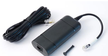
ISDN-KIT bestehend aus ISDN Modem, ISDN-Kabel und Verbindungsclip (optional erhältlich)