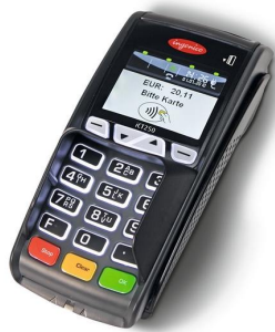
iCT220/iCT250 (Abbildung entspricht iCT250)