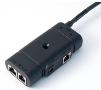
Anschlussbox (ab Werk vormontiert)